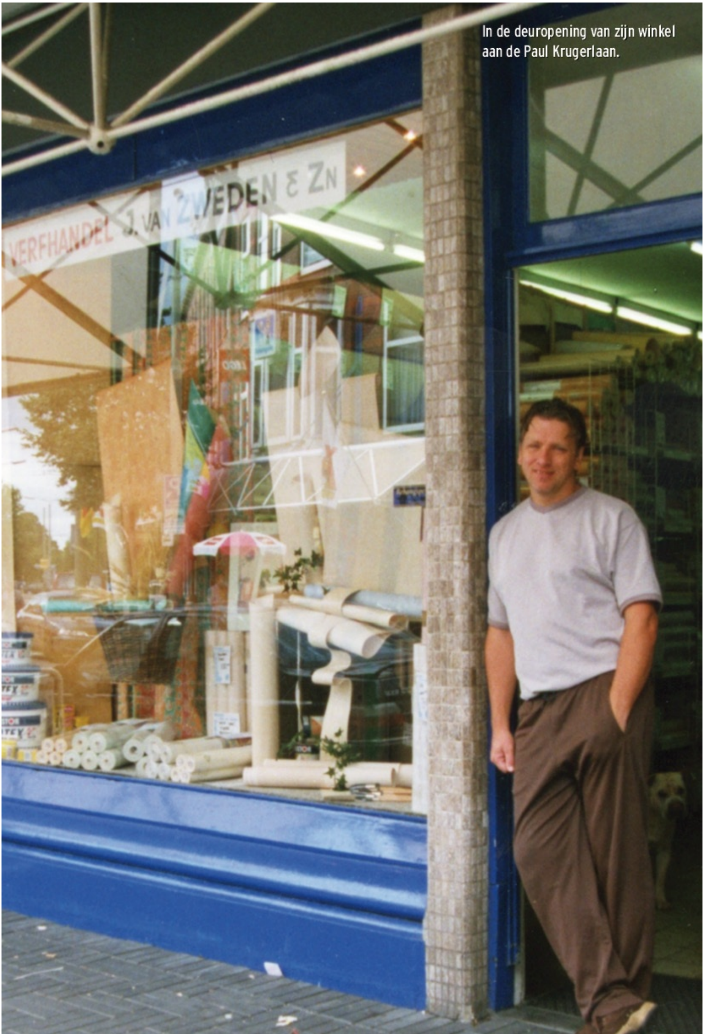
In de deuropening van zijn winkel aan de Paul Krugerlaan.