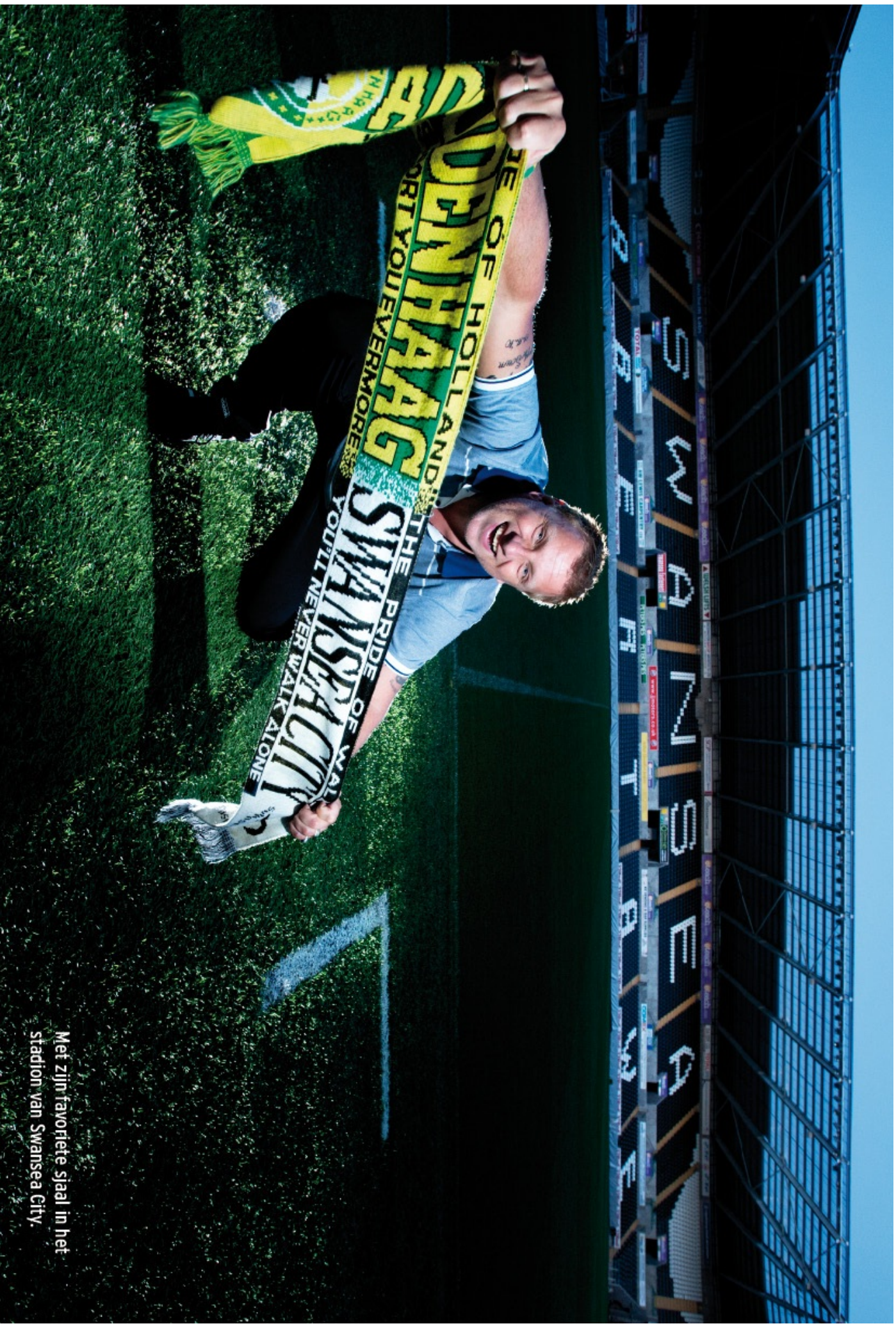
Met zijn favoriete slaal in het stadion van Swansea City.