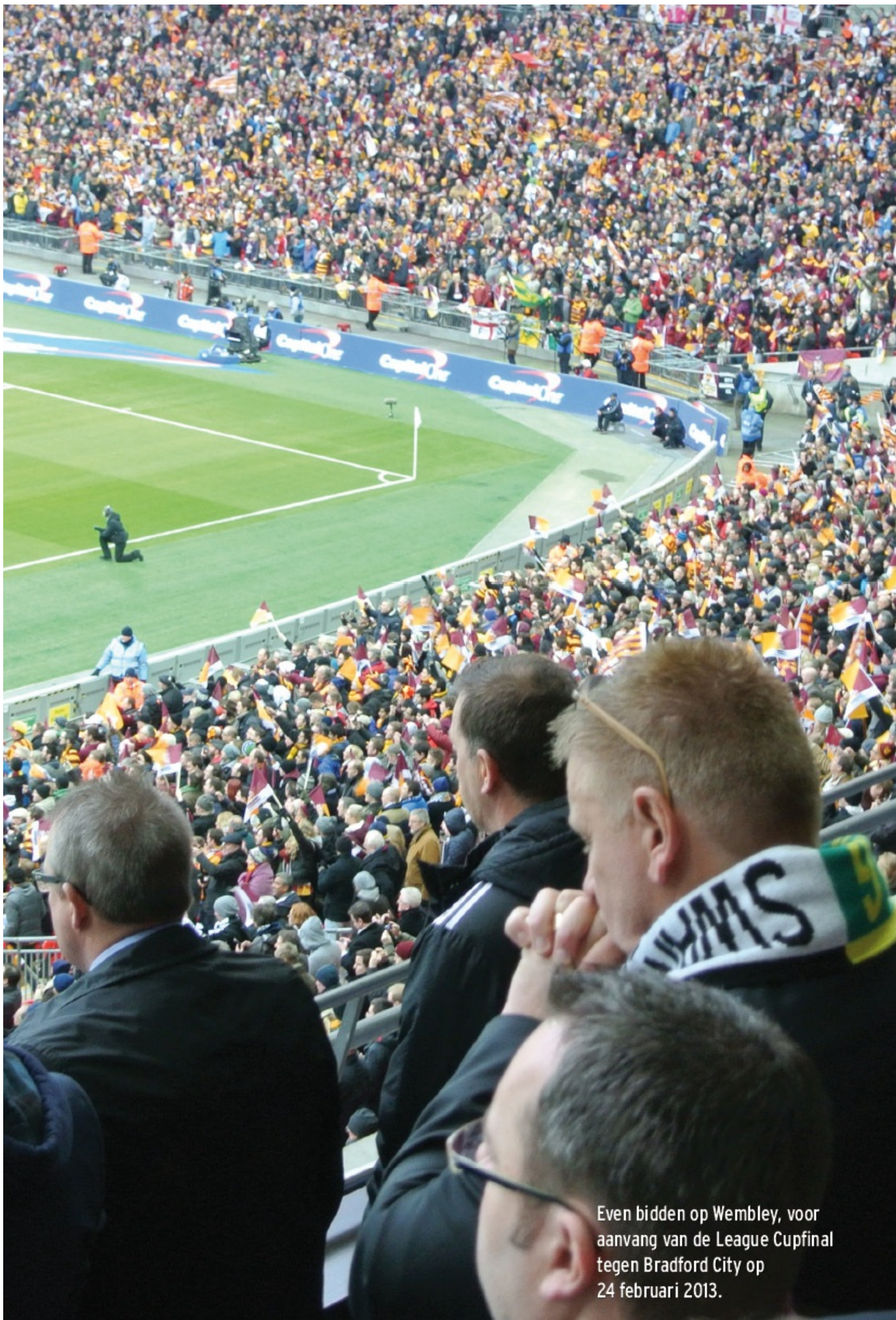
Even bidden op Wembley, voor aanvang van de League Cupfinal tegen Bradford City op 24 februari 2013.